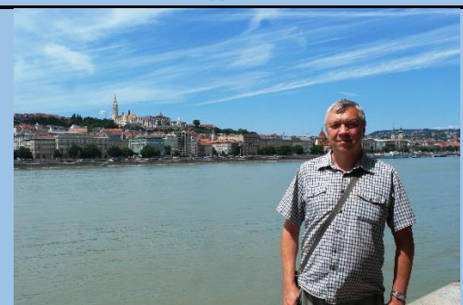
Вдалеке рыбацкий бастион