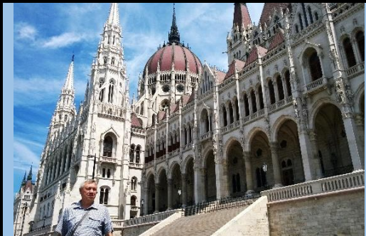
Еще раз парламент