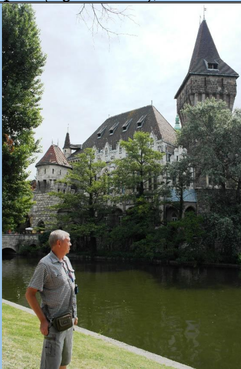
Замок Вайдахуняд в будапештском парке