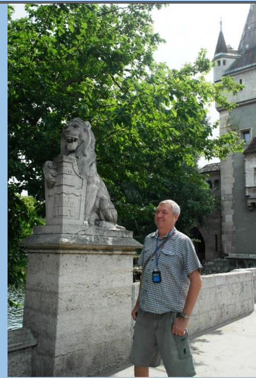
Вход в замок