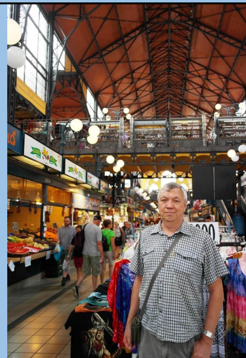
Центральный рынок Будапешта