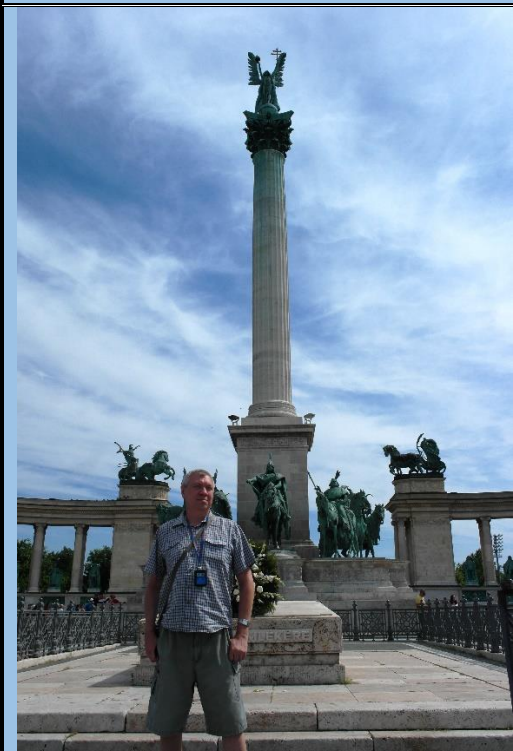
Мемориал тысячелетия на площади героев