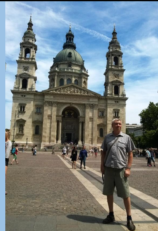
Базилика св. Иштвана (Стефана)