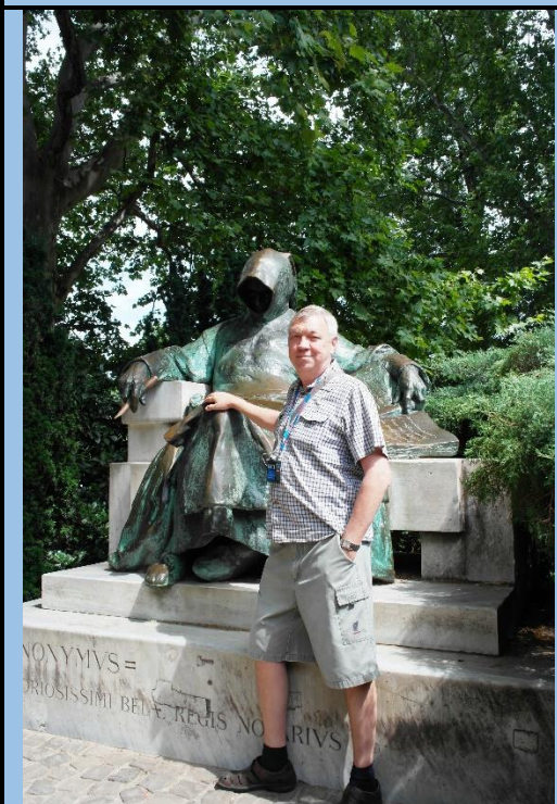
Анонимус – летописец короля Белы