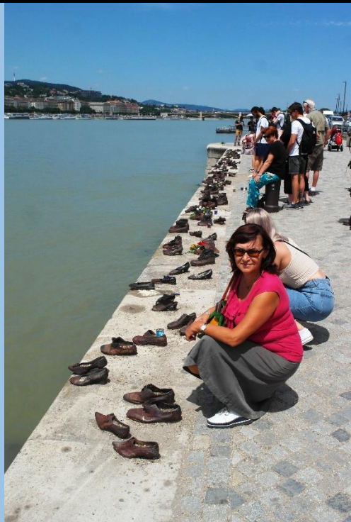
Памятник жертвам холокоста