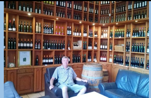
Винотека (очень много токайского)