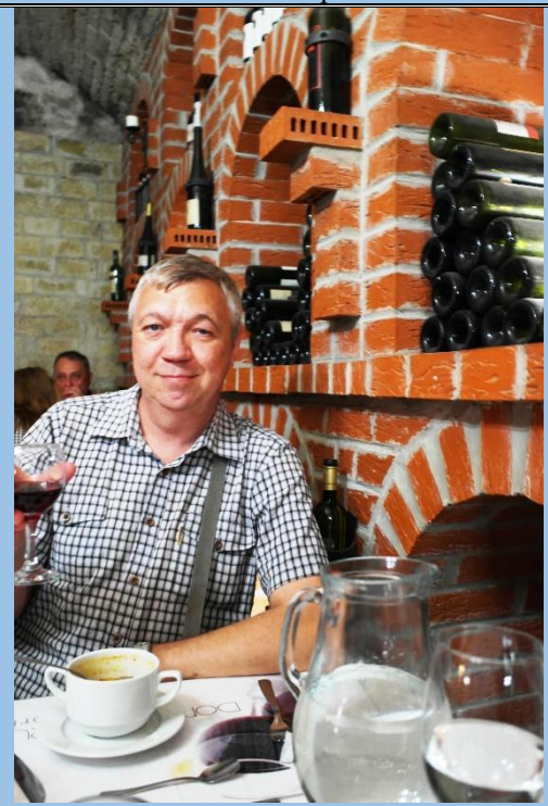
Обедаю в подвальчике