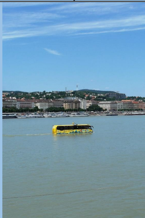
Плавучий автобус на Дунае