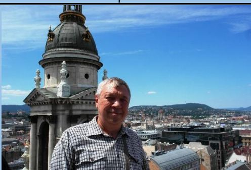
На крыше базилики