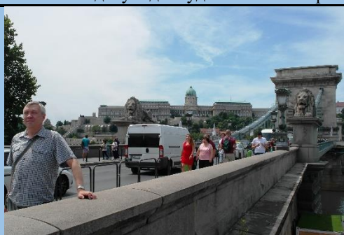
Цепной мост через Дунай (сзади королевский дворец)