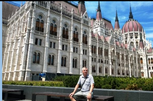
Парламент с другой стороны