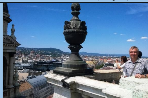
Вазоны на крыше