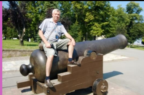
Верхом на пушке