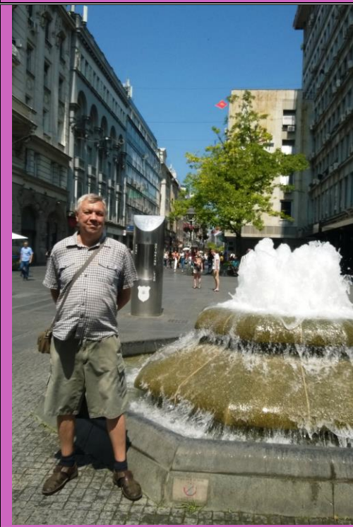
Улица князя Михаила