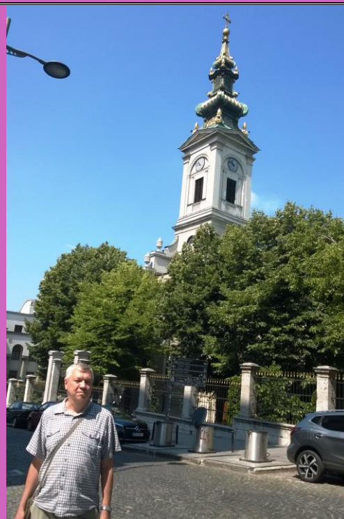
Колокольня собора архангела Михаила