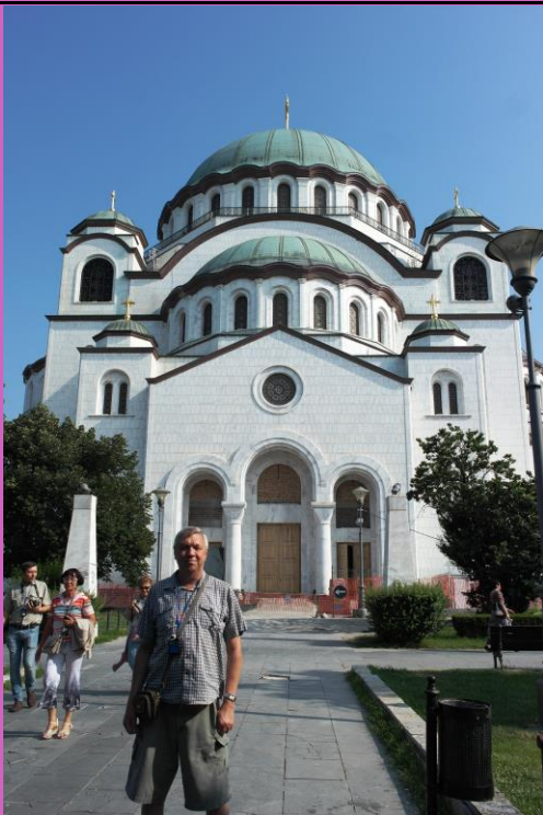
Белград, собор св. Саввы