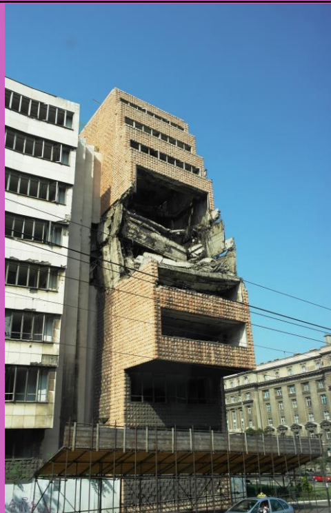
Разбомбленный генеральный штаб