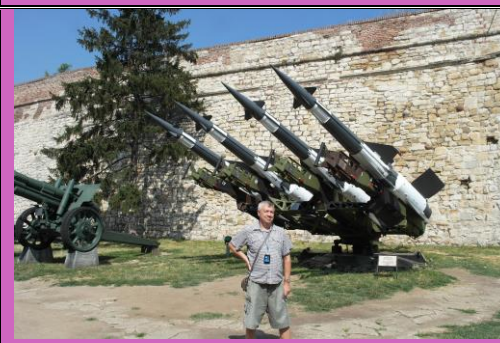
Советский комплекс ПВО С-125