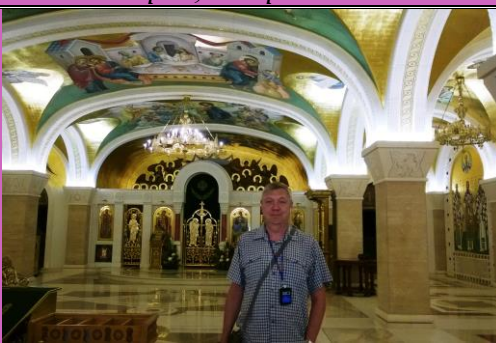
Нижняя церковь собора