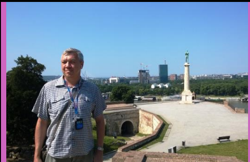
На фоне памятника Победителю