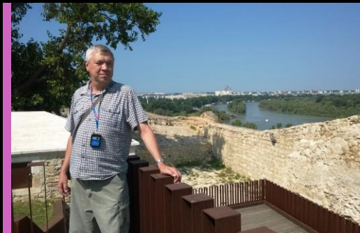
Вид на Дунай