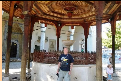
Источник для омовения ног