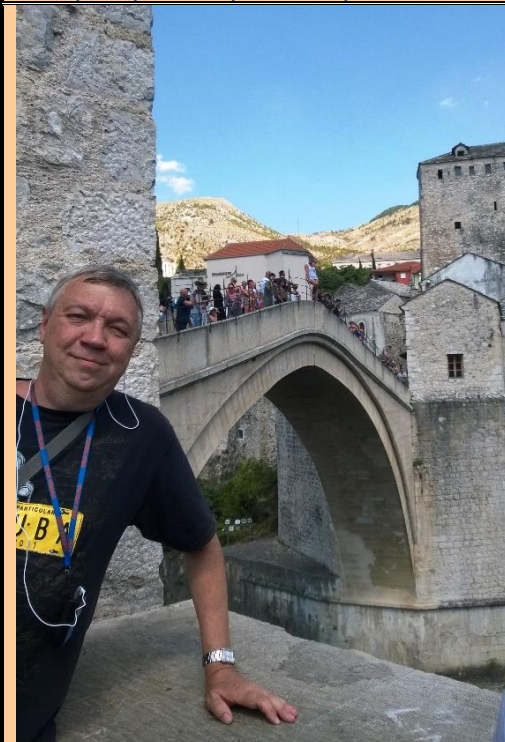
Мостар. Знаменитый мост, с которого ныряют (был разрушен в 1993 г. во время войны хорватов и мусульман)