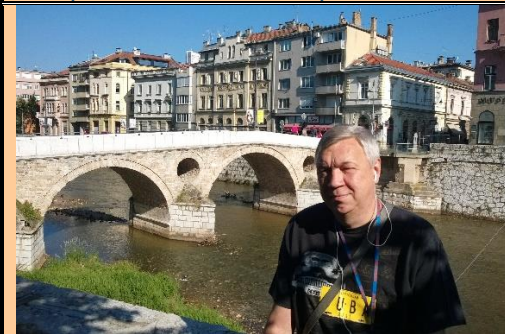
Мост Латинска Чуприя. Здесь убили эрцгерцога Франца Фердинанда