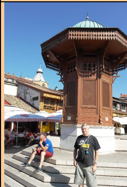
Босния и Герцеговина. Сараево. Голубиная площадь и фонтан Себиль