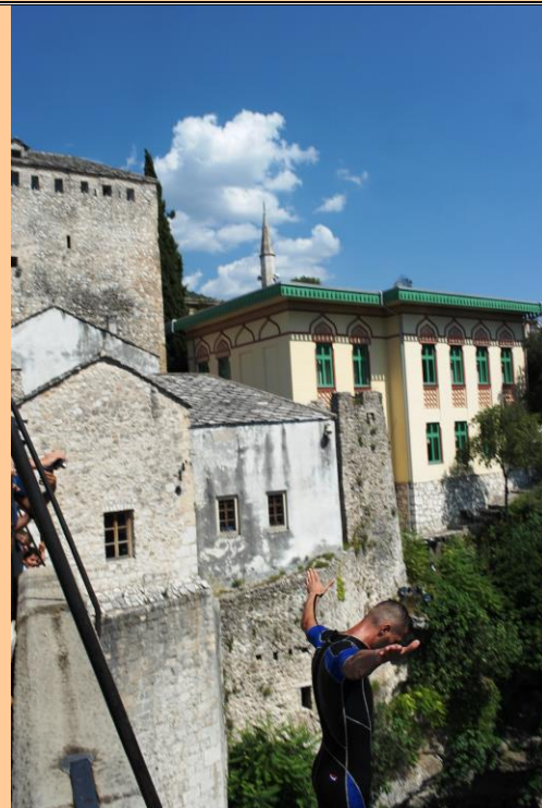
Сейчас он сиганет