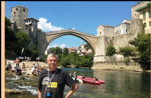
Пляж под мостом на реке Неретва