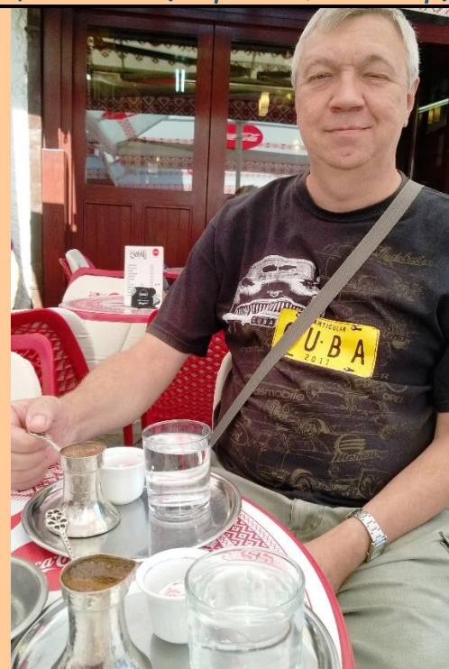
Кофе по-боснийски с рахат-лукумом и водой