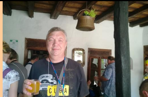
В гостях у местного населения