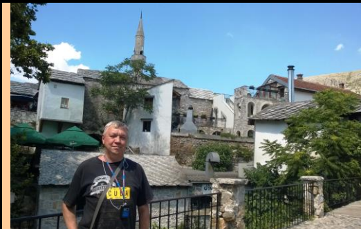
На фоне минарета